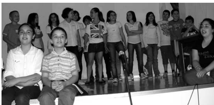
Il gruppo di 5 a elementare