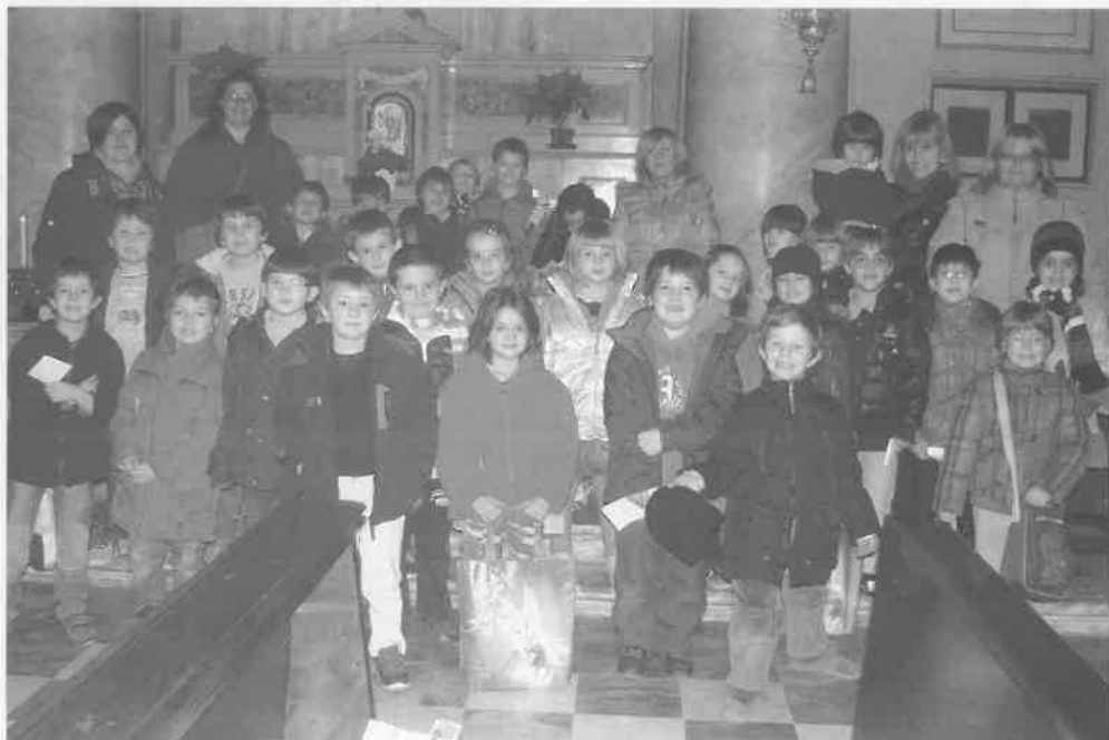
Il gruppo dei più piccoli - 1ª elementare con le loro catechiste