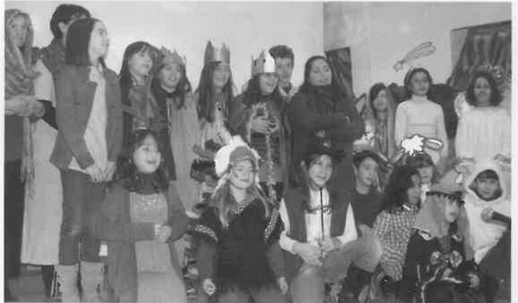
Ricordando lo spettacolo di Natale

La Chiesa era piena di pubblico che ha applaudito con gratitudine il gruppo di musicisti di Vieste (Puglia) nel concerto 'Note sull'onda di una vita': un'iniziativa di solidarietà che si ripete ogni anno in diverse città italiane con l'intento di far conoscere, attraverso concerti, cene, banchetti, i progetti di aiuto ai più poveri che AVSI sostiene in tutto il mondo e di raccogliere fondi per il loro sviluppo. La Fondazione AVSI è una organizzazione non governativa, ONLUS, nata nel 1972 impegnata con oltre 120 progetti di cooperazione allo sviluppo in 37 paesi del mondo in Africa, America latina e Carabi, Est Europa, Medio Oriente ed Asia. AVSI opera nei settori dell'educazione, sanità, igiene, cura dell'infanzia in condizioni di disagio, formazione professionale, sviluppo urbano, sicurezza alimentare, agricoltura, ambiente, micro-imprenditorialità e aiuto umanitario di emergenza. La sua missione è promuovere la dignità della persona attraverso attività di cooperazione allo sviluppo con particolare attenzione all'educazione, nel solco dell'insegnamento della Dottrina Sociale Cattolica.