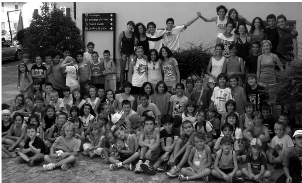
Estate Ragazzi 2011: un bellissimo ricordo di gioiose giornate

ore 20,45 in Oratorio nello "spazio per la preghiera": incontro di preghiera aperto a tutti